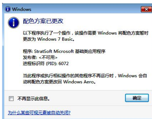
配色方案更改提示

如下图，原来采用的主题是 Windows Aero，运行 STRAT 是，电脑自行讲配色方案改为 Windows 7 Basic。