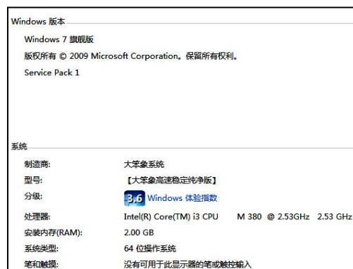
Windows 7 64 位操作系统可以运行 STRAT 软件